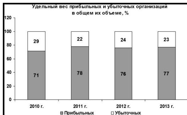
Рис. 1. Соотношение прибыльных и убыточных организаций в сельском хозяйстве РФ [1]

стую используются предприятиями как оборотные средства, что в условиях инфляции оправданно, но полностью противоречит природе амортизационных отчислений. Во-вторых, уровень рентабельности средних и малых предприятий в сельском хозяйстве достаточно низок (порядка 10-15%), а около 25% сельхозпредприятий являются убыточными (рис. 1).