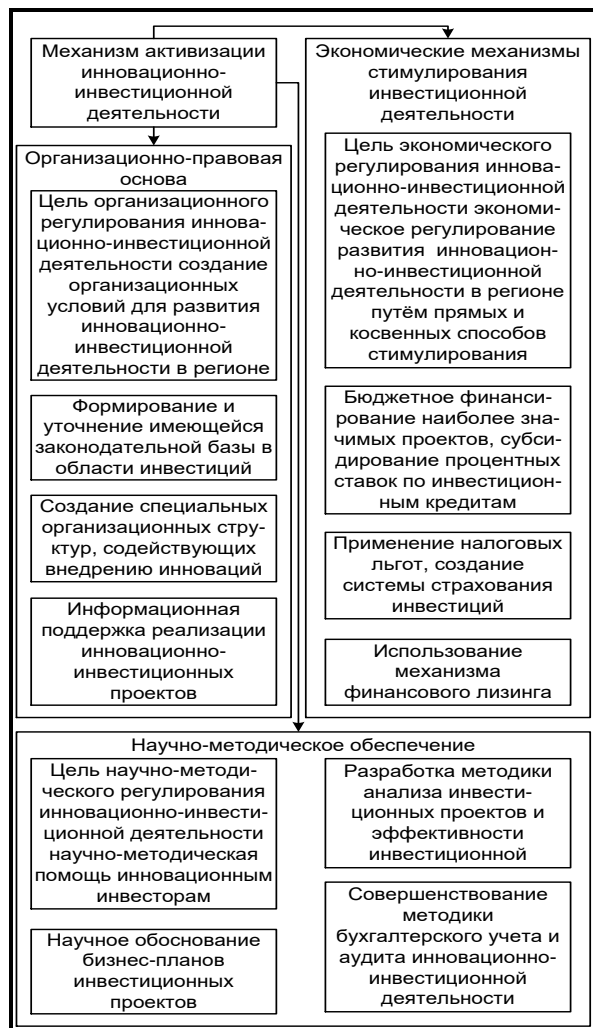
Рис. 2. Механизм активизации инвестиционной деятельности в Орловской области

кая форма налогового стимулирования будет способствовать более активному внедрению инноваций в производство, повышению эффективности инвестиционной деятельности [1].