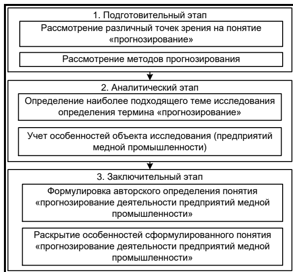
Рис. 3. Этапы формулировки авторского определения понятия «прогнозирование предприятий медной промышленности»

Набор процедур и порядок их реализации при формулировке авторского определения термина «прогнозирование деятельности предприятий медной промышленности» может быть представлен в виде следующего набора этапов (рис. 3).