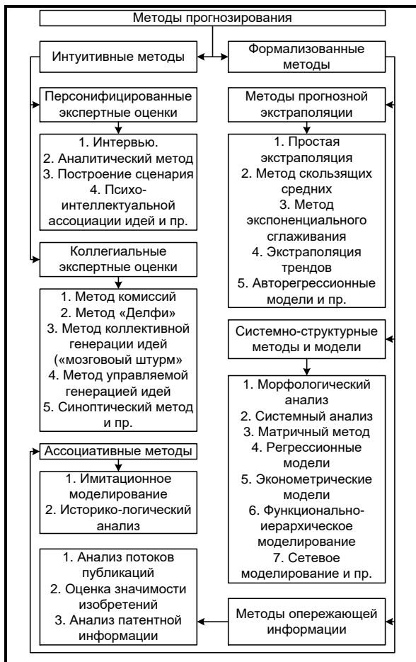
Рис. 1. Классификация методов прогнозирования [2, 3, 4]

При этом перечень методических процедур, применяемых для целей прогнозирования, можно структурно представить следующим образом (рис. 1).