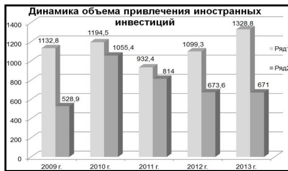
Рис. 2. Объем привлеченных иностранных инвестиций в Калужскую область, млн. долл. США 3

Нарушение положительной динамики объема инвестиций в 2015 г. связано в первую очередь с общими негативными тенденциями в российской и мировой экономике, а также с достигнутой ранее более высокой базой сравнения. Динамика объема привлечения иностранных инвестиций представлена на рис. 2.