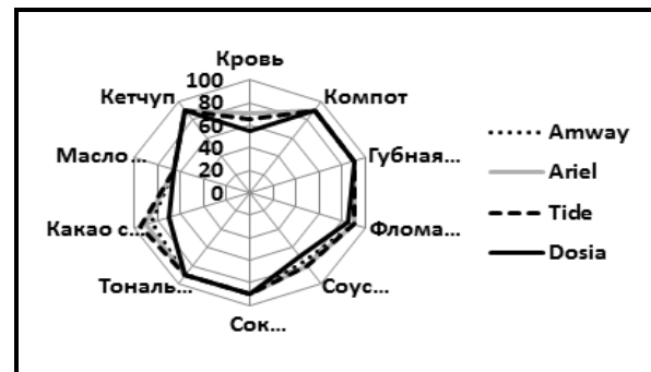
Рис. 2. Комплексный показатель моющей способности стиральных порошков после второй стирки, %

Качество стирки представлено с помощью диаграммы, которая показывает, что чем больше площадь охвата, тем выше показатель моющей способности [5, с. 6].