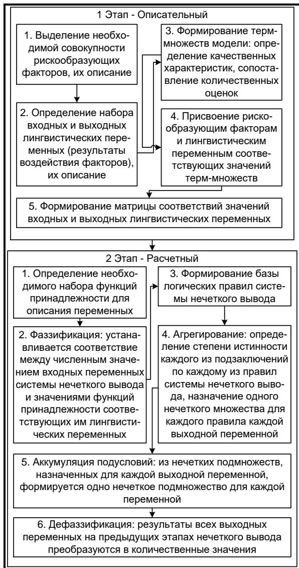
Рис. 1. Модель реализации процесса оценки рискообразующих факторов на основе теории нечетких множеств

аппарата теории нечетких множеств приведена на рис. 1.