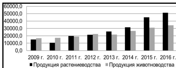
Рис. 1. Производство продукции растениеводства и животноводства в хозяйствах всех категорий, тыс. руб.

Аграрная отрасль Пензенской области на протяжении последних лет продолжает уверенно демонстрировать рост, оставаясь основой экономики региона. Объем продукции сельскохозяйственных организаций всех категорий за последний год составил 88,3 млрд. руб., что на 7,1% больше уровня предыдущего года. На рис. 1 рассмотрим производство продукции растениеводства и животноводства в хозяйствах всех категорий.