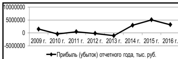
Рис. 2. Динамика финансовых результатов всех сельскохозяйственных организаций Пензенской области

Из рис. 1 видно, что в регионе происходит ежегодный рост объемов продукции растениеводства в хозяйствах всех категорий. Так, в 2016 г. объем продукции от отрасли растениеводства превысил 40 млн. руб., когда как в 2013 г. он не достиг даже отметки в 20 млн. руб. Динамика производств продукции животноводства менее подвижна, но в 2016 г. наблюдается определенный прогресс, так как в денежном выражении она достигает уровня чуть более 30 млн. руб., при прочих равных условиях в 2013 г. она составляла всего около 20 млн. руб. Финансовые результаты деятельности сельскохозяйственных организаций региона представлены на рис. 2.