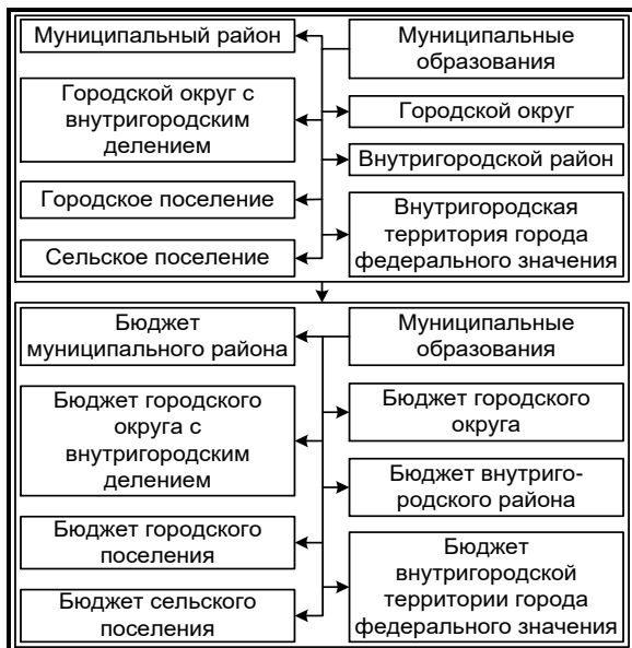
Рис.1. Классификация местных бюджетов в РФ 1

вокупные значения по бюджетам всех муниципальных образований.