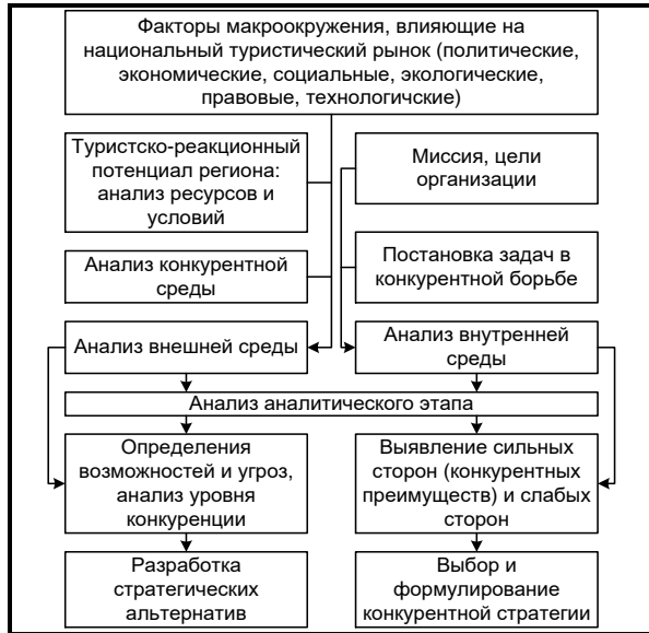
Рис. 2. Концептуальная модель разработки конкурентной стратегии для организаций индустрии туризма с учетом туристско-рекреационного потенциала региона

Второе – анализ туристско-рекреационного потенциала предполагает выделение структуры данного уровня внешней среды. Согласно приведенному выше определению, в ТРП можно выделить две составляющие -- ресурсы и условия, в которых в свою очередь выделяются укрупненные блоки (рис. 3).