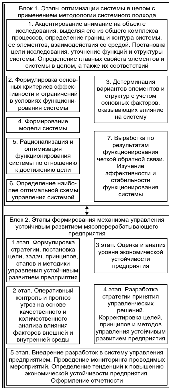
Рис. 2. Алгоритм поэтапного формирования механизма управления устойчивым развитием мясоперерабатывающего предприятия с применением методологии системного подхода

лен алгоритм поэтапного формирования механизма управления устойчивым развитием предприятия мясоперерабатывающей отрасли.